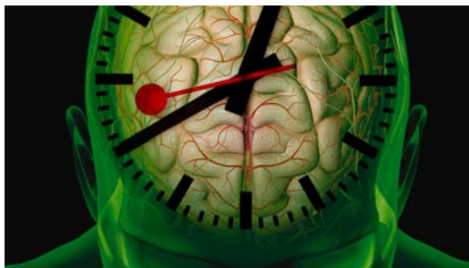
Wie das „Gehirn“ der sexuellen Vielfalt tickt ... 85