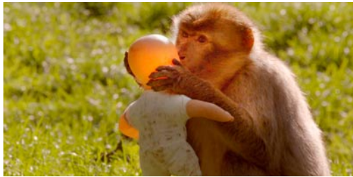
Affenjungen spielen mit Autos, Affenmädchen mit Puppen ... 10